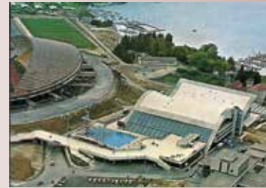
SC Poljud bazeni