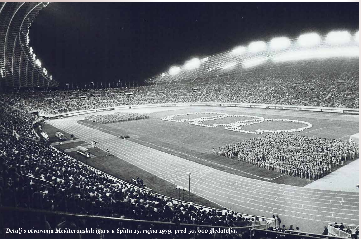
Detalj s otvaranja Mediteranskih igara u Splitu 15. rujna 1979. pred 50. 000 gledatelja.