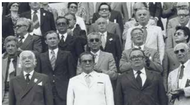
Na otvaranju MIS-a 1979. bio je veliki broj uglednika iz svijeta športa i politike. Slijeva: Michael Moris lord Killanin, predsjednik Međunarodnog olimpijskog odbora, Josip Broz Tito, predsjednik Jugoslavije i Stane Dolanc, predsjednik Izvršnog komiteta VIII. Mediteranskih igara

Službeni znak VIII. Mediteranskih igara bila su tri kruga što izviru iz mora. Simboliziraju prijateljstvo i povezanost tri kontinenta na obalama Mediterana. Autor dizajna je akademski slikar Boris Ljubičić iz Zagreba. Ovaj znak je prihvaćen kao službeni znak svih narednih Mediteranskih igara