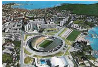
SC Poljud gradski stadion